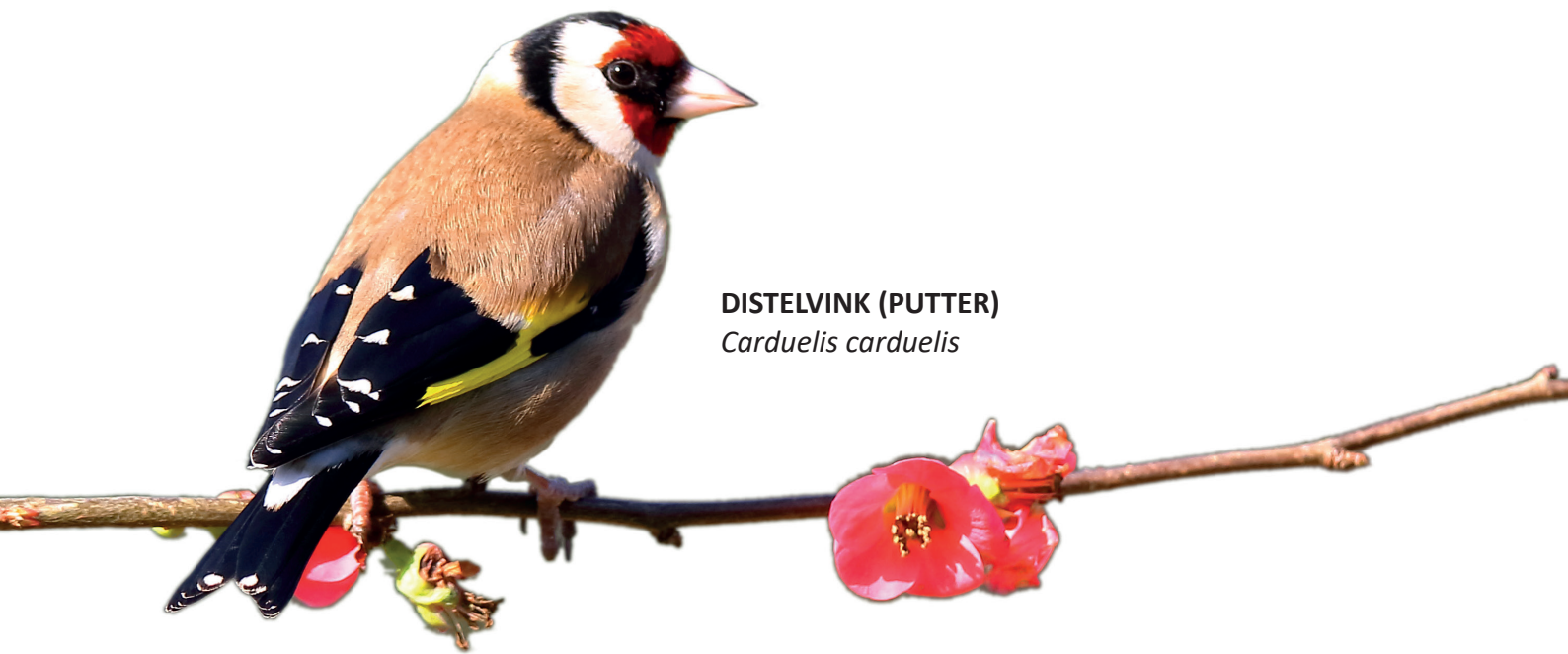
DISTELVINK (PUTTER) Carduelis carduelis