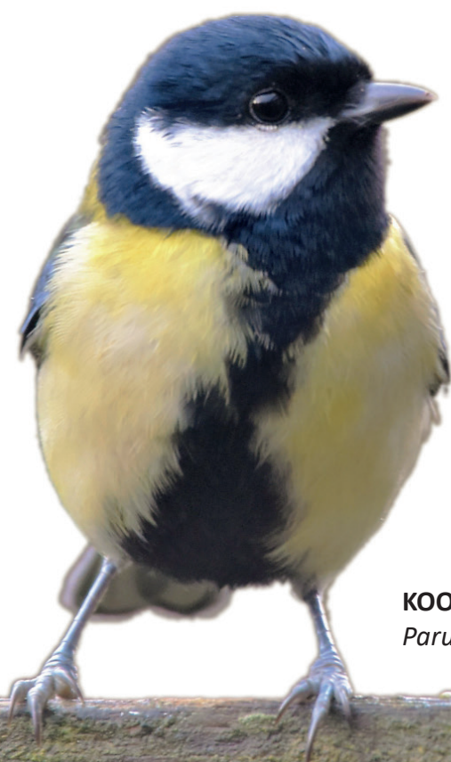
KOOLMEES Parus major

LIDGELD € 24,00 euro/jaar € 18,00 euro/jaar (jeugd tot 18 jaar) Maandelijks tijdschrift KBOF Driemaandelijks contactblad € 12,00 euro/jaar (steunend lid) Driemaandelijks contactblad OPLAGE 300 exemplaren WEBSITE www.kbof-roeselare.be