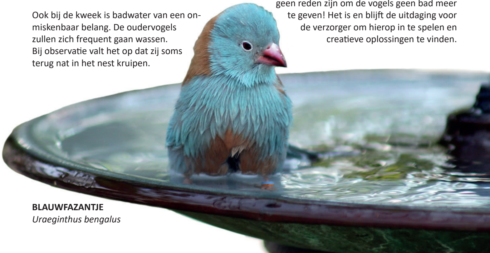
BLAUWFAZANTJE Uraeginthus bengalus

Zo vermijdt men uitbraken van ziektekiemen en blijven de vogelverblijven netjes. Ik kan het uit eigen ervaring garanderen dat er soms vogels zijn die zichzelf schoon maken, maar die hun verblijf omtoveren tot een hele vieze boel. Dit mag echter geen reden zijn om de vogels geen bad meer te geven! Het is en blijft de uitdaging voor de verzorger om hierop in te spelen en creatieve oplossingen te vinden.